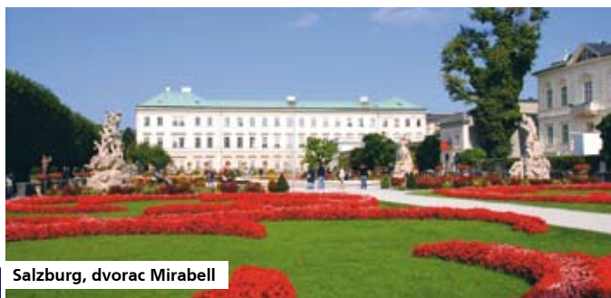
Salzburg, dvorac Mirabell

Polazak autobusom iz Zagreba s Autobusnog kolodvora (peroni 502-506) u 6.00 sati. Vožnja kroz Sloveniju i Austriju do Graza. Po dolasku, razgledavanje povijesne jezgre grada u pratnji mjesnog vodiča: Glavni trg, Gradska vijećnica, Opera, zvono Glockenspiel, Kaštel, staro Isusovačko sveučilište, katedrala i mauzolej. Posjet otoku mostu na rijeci Muri, jednom od futurističkih čuda koje u sebi sadrži amfiteatar, igralište i kavanu, kako biste doživjeli Graz 21. stoljeća. Nakon kraćeg slobodnog vremena, nastavak vožnje prema Salzburgu. Po dolasku, prijava i smještaj u hotel. Slobodno vrijeme za vlastite programe. Preporučujemo posjet dvorcu Hohensalzburg uz individualan obilazak. Noćenje.